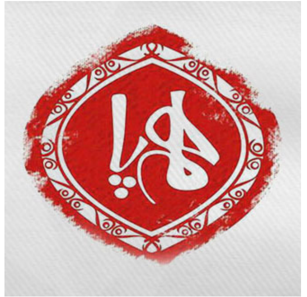
ورود به سامانه همپا